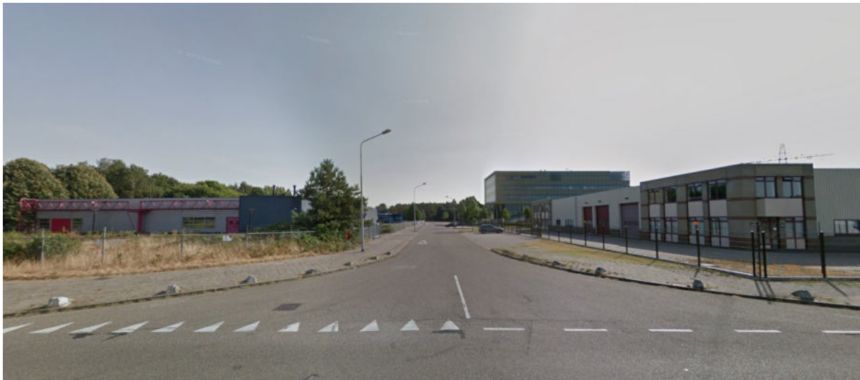
Street View - aug. 2018

De gegevens in de BAG suggereren dat de geometrie van de Microweg (openbare ruimte ID 0268300000000098) niet meer is gewijzigd sinds het raadsbesluit d.d. 4 november 1987 dat als brondocument in de basisregistratie is ingeschreven (Begin geldigheid 04-11-1987).