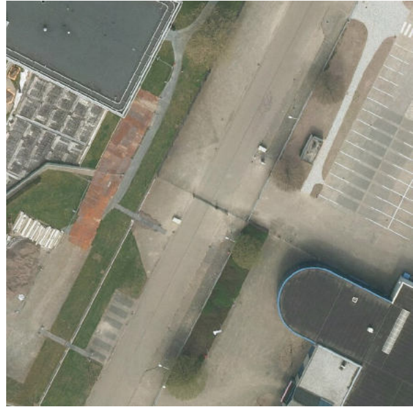
2021 - Microweg (oostelijk deel) met hek

Op de luchtfoto's uit 2021 is te zien dat er op verschillende plaatsen hekken zijn geplaatst. Aan het begin van de Microweg is een witte streep aangebracht. Aan de zuidkant van het westelijke en het oostelijke deel van de weg zijn gesloten hekwerken zichtbaar. Hierdoor is de verbinding tussen beide delen over een lengte van ca. 275 m afgesloten.