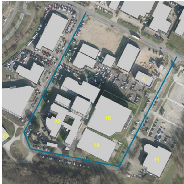
BAG panden (PDOK Viewer) met enkele huisnummers

De adressen Microweg 4, 11, 16 18 en 21 Nijmegen liggen in de verschillende delen die 2012 en 2020 aan het openbaar verkeer zijn onttrokken. In het voorstel voor de aanpassing van de geometrie van de Microweg in de woonplaats Nijmegen staat: