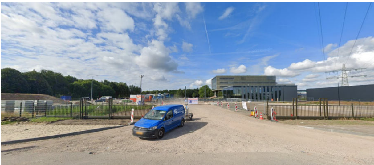
Street View - juli 2022